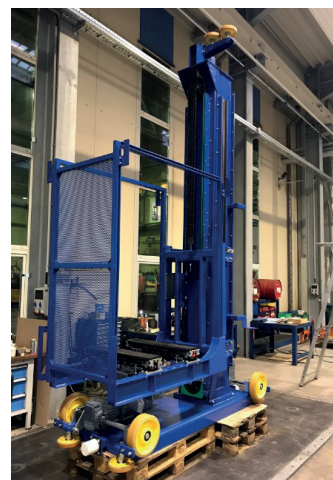
Verfahrwagen mit Hub